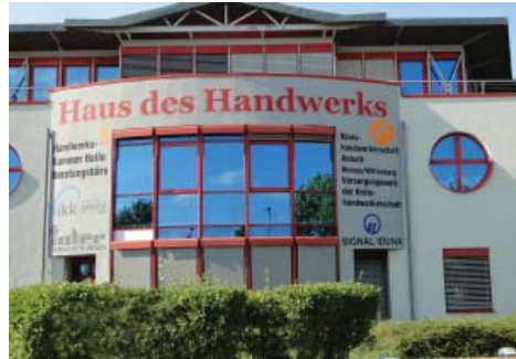
Kochstedter Kreisstraße 44